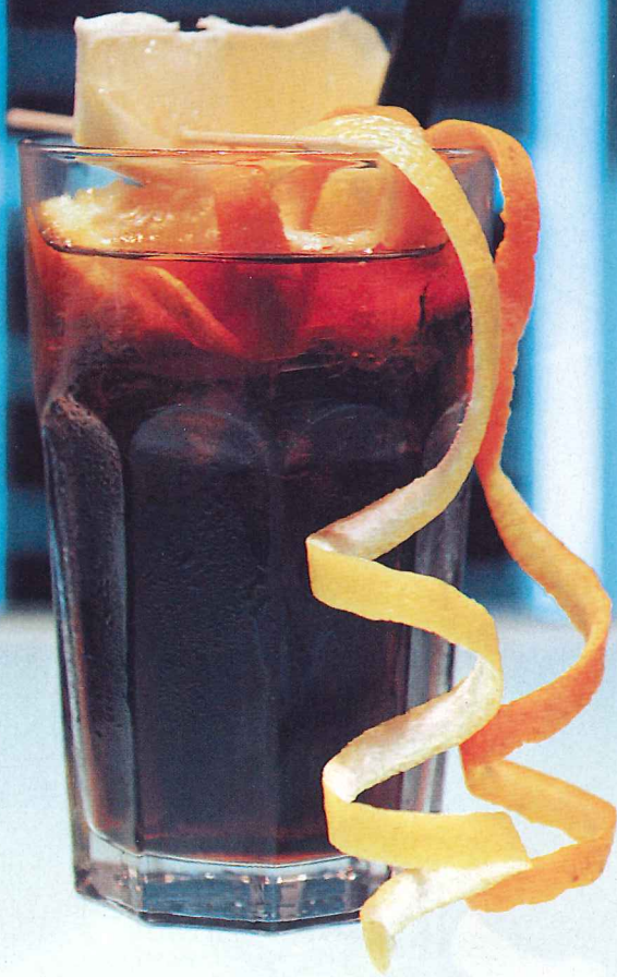
I tre cocktail a base di chinotto del bar Angelo dell'Aleph di Roma

QUALCHE MESE FA sul Wall Street Journal, Eric Felten, uno dei massimi esperti del bere miscelato, autore del celebre How's Your Drink? Cocktails, Culture and the Art of Drinking Well , parlava del chinotto come del più promettente ingrediente per i cocktail, considerata la proprietà amaricante del frutto in grado di sostituire i liquori amari nei drink e citava tra i marchi, oltre al colosso S. Pellegrino, un piccolo produttore di Tortona: Abbonadio. Sembrano davvero lontani i tempi in cui sono nate le associazioni di appassionati per tener viva una bevanda a rischio di estinzione, offuscata dal successo della Coca Cola e delle sue sorelle.